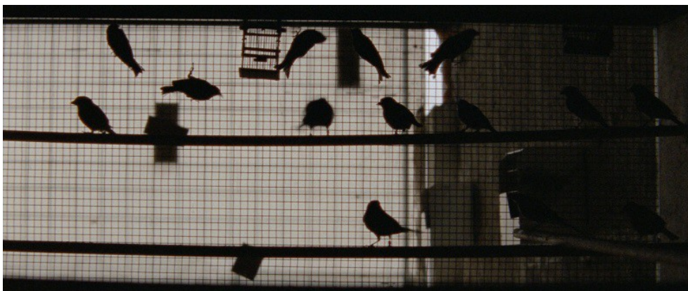
As Mil e Uma Noites. O Encantado (Miguel Gomes, 2015)

O dispositivo deste segmento remonta claramente a Gil Vicente (c.1465-c.1536), o pai do teatro português. Tal como a moral vicentina ( ridendo castigat mores , em latim), Miguel Gomes propõe-se a denunciar no espaço público os piores defeitos, costumes e imoralidades do povo português. A tipificação social das personagens pretende representar a sociedade no seu todo, revelando uma promiscuidade e ambiguidade em que todos são culpados e responsáveis pelo estado generalizado de decadência social e moral. O tom tragicómico e satírico desse 'rosário de desgraças', acentuado por algumas das personagens como o 'rapaz estúpido' que 'queria pito' (Gonçalo Waddigton) ou os caretos transmontanos, serve ainda para acentuar esta espécie de catarse coletiva que poderia levar a uma eventual redenção.