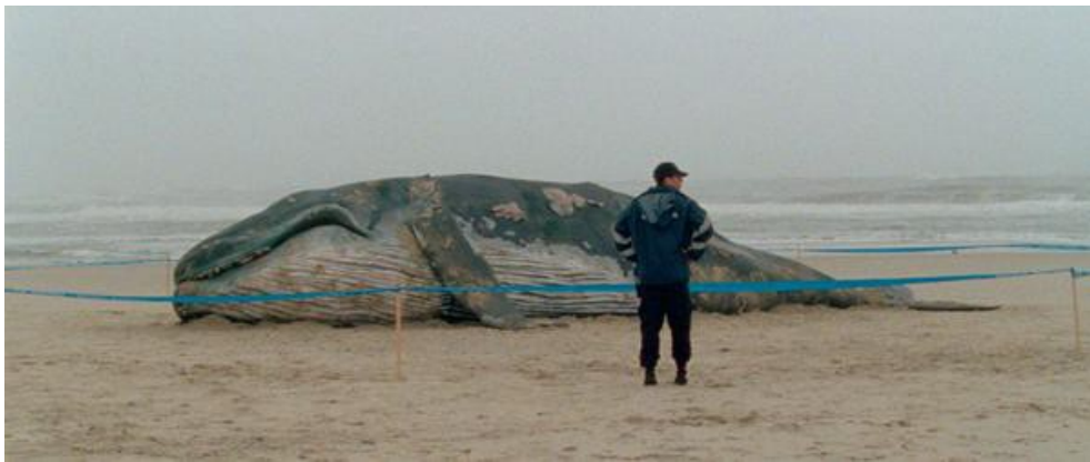
As Mil e Uma Noites. O Inquieto (Miguel Gomes, 2015)

políticas para o cinema português. Na suposta rábula meta-fílmica inicial, em que o cineasta impotente foge da sua equipa, há imenso sarcasmo e ironia quando o próprio cineasta confessa que “os escassos recursos do cinema português não serão compatíveis com os (...) devaneios” deste filme (referindo-se, de forma mais abrangente, ao cinema de autor) e que revela “alguma irresponsabilidade” que poderá “comprometer a lei n.º 55/2012 de 6 de Setembro”, a recente lei do cinema e do audiovisual que pretende, mais uma vez, um compromisso entre o cinema artístico e a indústria do entretenimento. Politicamente, o filme é um manifesto criativo e ousado de uma posição intransigente que defende o cinema como uma forma de expressão artística, cultural e cívica.