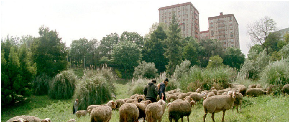
As Mil e Uma Noites. O Desolado (Miguel Gomes, 2015)

No primeiro caso, segue-se a história de Simão 'Sem Tripas', e a sua fuga à polícia por entre os montes do interior de Portugal. É uma sequência particularmente solitária, em que Simão vai percorrendo alguns locais, numa espécie de tranquilidade estranha. Há uma certa violência que se depreende (vê-se mesmo um corpo morto), mas fica tudo demasiado suave, aliás como a própria captura de Simão, na sua casa, sem oferecer resistência. A paisagem quente da serra parece fazer esconder segredos muito bem guardados, de crimes geracionais. Simão é um culpado que é recebido euforicamente pelo povo, por ter enganado o poder policial. A personagem de Simão e o seu episódio são ambivalentes, porque contradizem uma história não vista (o assassinio), com a imagem franzina e até simpática da personagem. Nada é simples na análise do real.