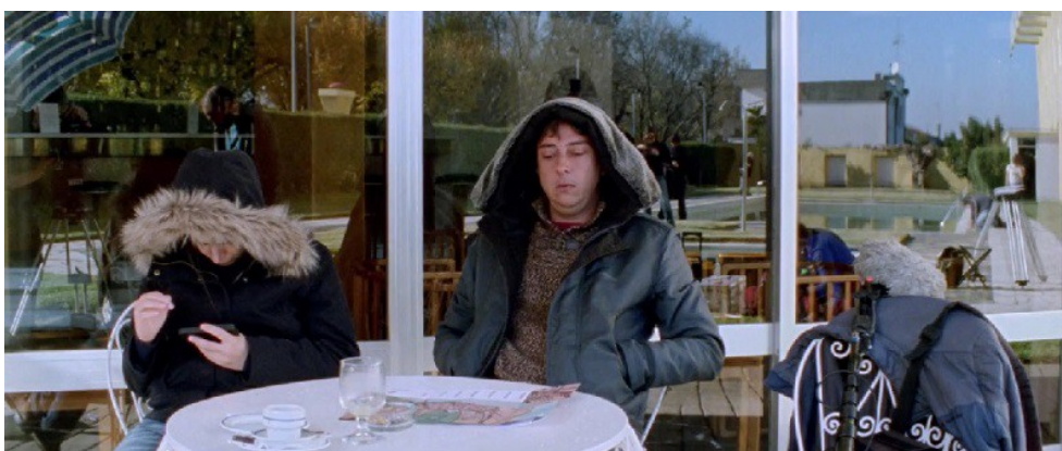
As Mil e Uma Noites. O Inquieto (Miguel Gomes, 2015)